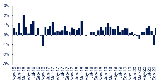
Kinerja Bulanan Selama 5 Tahun Terakhir